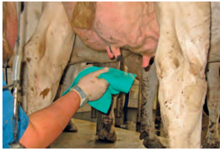
Das Eutertuch ist aus Cellulose und Baumwolle gefertigt.

Mit den in der Vergangenheit eingesetzten Eutertüchern war man nicht zu